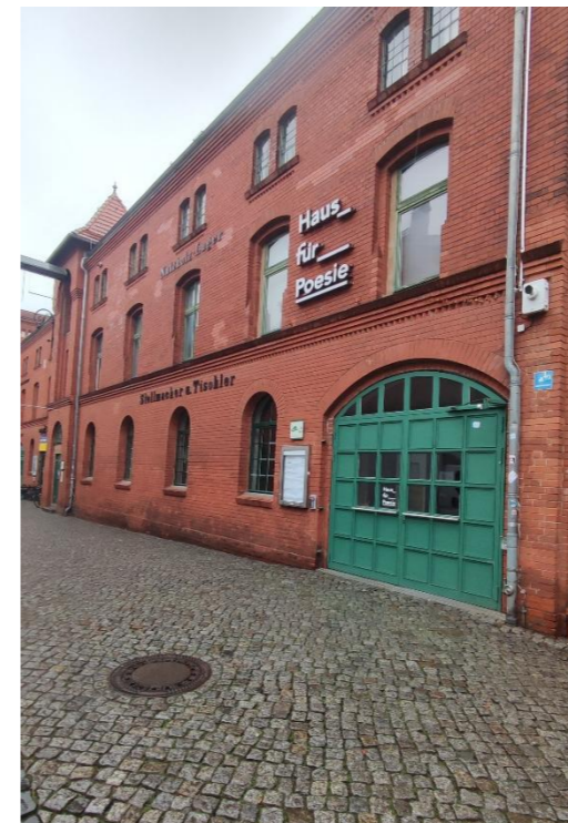
Eingang durch das grüne Tor