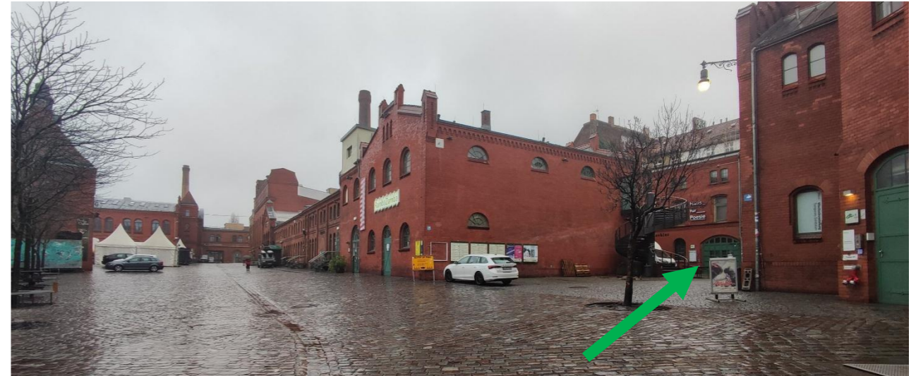
Zugang zu Gebäude 8 vom Eingang Knaackstr. aus fotografiert