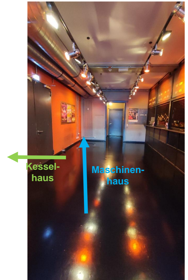
Gemeinsames Foyer mit Garderobe