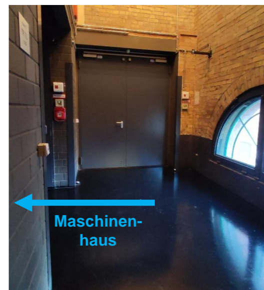
1. OG. Minifoyer vor dem Maschinenhaus.